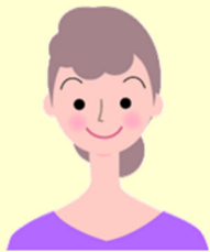
40代・日本舞踊 流山市在住

踊りを始めて数年経ち、大きい公演に出演させて頂くことになりました。日々特訓を重ねておりましたが、疲れのせいもあり、公演近くなって全身に違和感を感じるようになりました。そこで、踊りの先生に教えていただき、慌てて駆け込み治療して頂いた次第です。何より有難かったのは、本番間近に体だけでなく張りつめていた気持ちもリラックスでき、体のこわばりや痛みが驚くほど改善したことです。お陰様で大きな公演も無事に乗り切ることができました。今後は身体の張りを少しでも感じたら、伺いたいと思います。